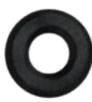
3.201.00 Kleberosette in Schwarzstahl-Optik*